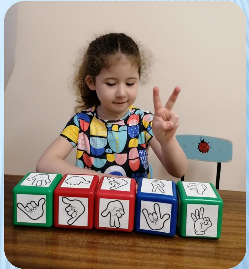
Игры на развитие переключаемости